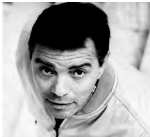
Γράφει ο Σπύρος Παπαστεφάνου